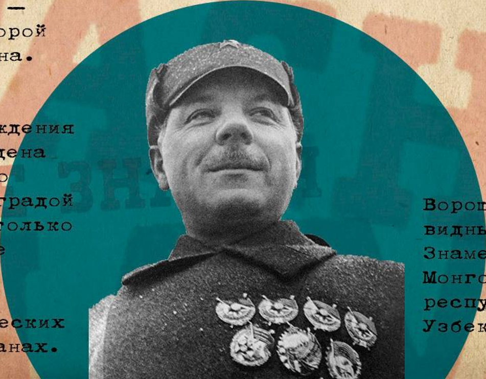
Ворошилов К.Е. На шинели видны орден Красного Знамени Закавказской СФСР, Монгольской Народной республики, Таджикской и Узбекской ССР.

Существовали варианты награды разных союзных республик, однако 1 августа 1924 года был учреждён единый орден Красного Знамени. Этот орден иногда вручался вместе с Почётным революционным оружием — пашкой, на ножнах которой было изображение ордена. Первыми такое оружие получили В.И. Шорин и С.С. Каменев. До учреждения 6 апреля 1930 года ордена Ленина, орден Красного Знамени был высшей наградой СССР. Его вручали не только за действия при защите социалистического отечества, но и за поддержку коммунистических движений в других странах.