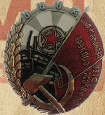
Орден Красного Знамени Грузинской ССР

Существовали варианты награды разных союзных республик, однако 1 августа 1924 года был учреждён единый орден Красного Знамени. Этот орден иногда вручался вместе с Почётным революционным оружием — пашкой, на ножнах которой было изображение ордена. Первыми такое оружие получили В.И. Шорин и С.С. Каменев. До учреждения 6 апреля 1930 года ордена Ленина, орден Красного Знамени был высшей наградой СССР. Его вручали не только за действия при защите социалистического отечества, но и за поддержку коммунистических движений в других странах.