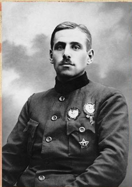
Портрет Фурманова Д.А. работы художника Малютина С.В.

Первым кавалером новой награды стал В.К. Блюхер, получивший орден за поход Уральской армии — партизанский рейд по тылам Добровольческой армии с целью выхода из окружения. Всего было совершено около 581 300 награждений.