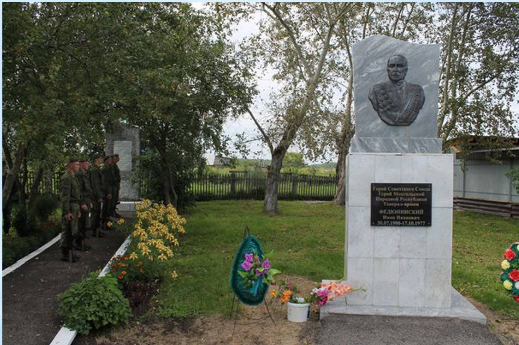
Памятник генералу армии И.И. Федюнинскому в деревне Гилёва.