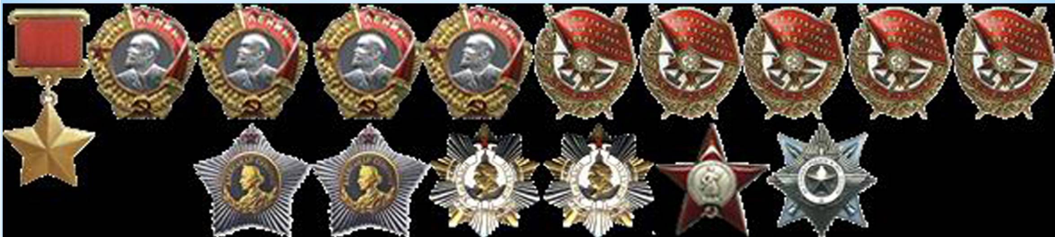
Награды генерала Федюнинского.

На завершающем этапе войны И. И. Федюнинский со своей армией держал, как говорится, «на замке», методично и неуклонно уничтожая запертую в котле на курляндском полуострове Латвии немецкую группировку из остатков группы армий «Север».