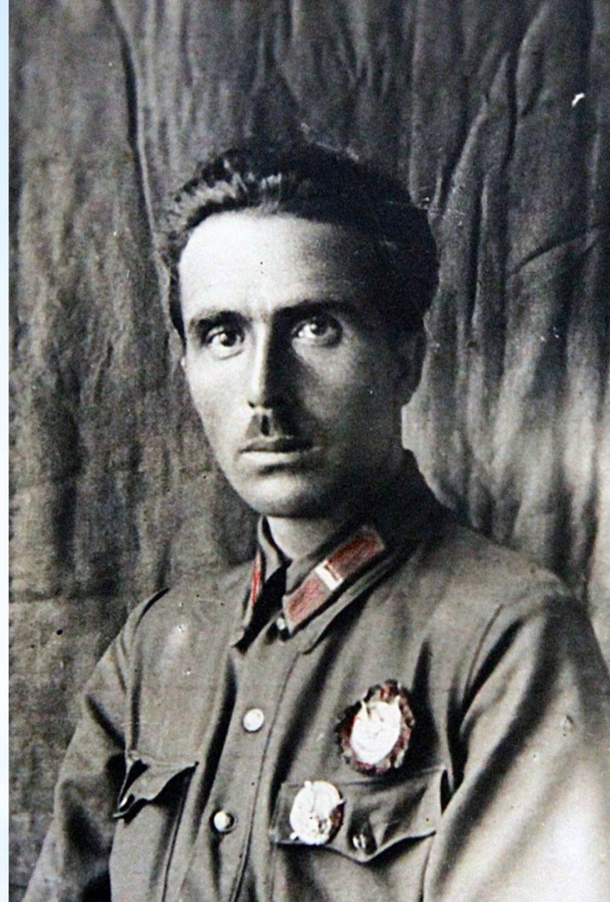
Капитан И.И. Федюнинский, 1929 год.

В октябре 1930 года был направлен на курсы комсостава «Выстрел». После окончания их с отличием вернулся на Дальний Восток, где был назначен командиром батальона, а в 1936 году помощником командира полка.