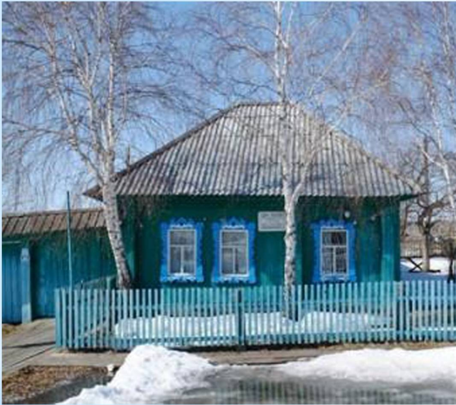
Дом семьи Федюнинских в деревне Гилёва.

Иван Иванович Федюнинский родился 30 июля 1900 года в деревне Гилёва Успенской волости Тюменского уезда Тобольской губернии (в настоящее время Тугулымский район Свердловской области), в семье крестьянина. Свою трудовую деятельность он начал в 13 лет подмастерьем маляра. В 1919 году будущий полководец добровольцем вступил в Красную Армию. Как один из лучших красноармейцев он в 1923 году был направлен на обучение во Владивостокскую пехотную школу, по окончании которой в 1924 году назначен командиром взвода в 107-й Владимирский стрелковый полк.