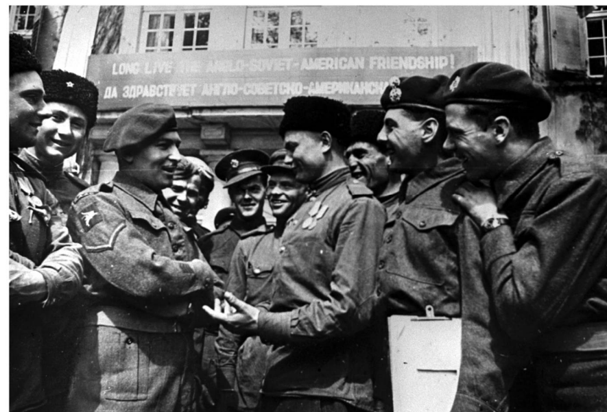
КАВАЛЕРИСТЫ 3-ГО ГВАРДЕЙСКОГО КАВАЛЕРИЙСКОГО КОРПУСА БЕСЕДУЮТ С БРИТАНСКИМИ СОЛДАТАМИ ВО ВРЕМЯ ВСТРЕЧИ КОМАНДУЮЩИХ ВОЙСКАМИ. 10 МАЯ 1945 Г.