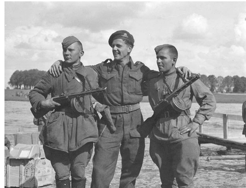
СОВЕТСКИЕ АВТОМАТЧИКИ И БРИТАНСКИЙ СОЛДАТ НА БЕРЕГУ ЗЛЬБЫ. МАЙ 1945 Г.

7 МАЯ 1945 ГОДА В ГОРОДЕ ВИСМАР СОСТОЯЛАСЬ ВСТРЕЧА КОМАНДУЮЩЕГО 2-М БЕЛОРУССКИМ ФРОНТОМ МАРШАЛА К.К. РОКОССОВСКОГО И КОМАНДУЮЩЕГО 21-Й ГРУППОЙ АРМИЙ ФЕЛЬДМАРШАЛОМ БРИТАНСКОЙ АРМИИ Б. МОНТГОМЕРИ. В МОМЕНТ ПРИБЫТИЯ К.К. РОКОССОВСКОГО И СОПРОВОЖДАЮЩИХ ЕГО ОФИЦЕРОВ БЫЛ ДАН САЛЮТ ИЗ 19 ОРУДИЙ. ВСТРЕЧА ПРОШЛА В ДРУЖЕСТВЕННОЙ ОБСТАНОВКЕ И ПРОДОЛЖАЛАСЬ ДВА ЧАСА. В ЧЕСТЬ СОВЕТСКИХ ГОСТЕЙ БЫЛ УСТРОЕН ПРАЗДНИЧНЫЙ ОБЕД. 10 МАЯ 1945 ГОДА СОСТОЯЛСЯ ОТВЕТНЫЙ ВИЗИТ КОМАНДУЮЩЕГО АНГЛИЙСКИХ ВОЙСК. В ПОЧЕТНОМ КАРАУЛЕ СТОЯЛИ БОЙЦЫ 17-ГО ГВАРДЕЙСКОГО КАВАЛЕРИЙСКОГО ПОЛКА: 4 САБЕЛЬНЫХ И ОДИН ПУЛЕМЕТНЫЙ ЭСКАДРОН В КОННОМ СТРОЮ В ПОЛНОЙ ТРАДИЦИОННОЙ КАЗАЧЬЕЙ ФОРМЕ. ПОСЛЕ ТОРЖЕСТВЕННОГО ОБЕДА СОСТОЯЛСЯ КОНЦЕРТ КРАСНОАРМЕЙСКОЙ ХУДОЖЕСТВЕННОЙ САМОДЕЯТЕЛЬНОСТИ. ПО ВОСПОМИНАНИЯМ К.К. РОКОССОВСКОГО, «...КАЖДЫЙ НОМЕР БРИТАНЦЫ ОДОБРЯЛИ ТАКИМИ НЕИСТОВЫМИ ОВАЦИЯМИ, ЧТО СТЕНЫ ДРОЖАЛИ».