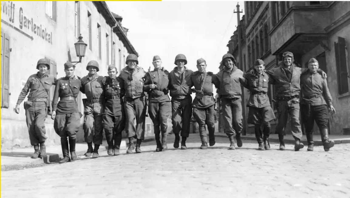
СОВЕТСКИЕ И АМЕРИКАНСКИЕ СОЛДАТЫ ИДУТ ПО УЛИЦЕ ТОРГАУ. 26 АПРЕЛЯ 1945 Г.