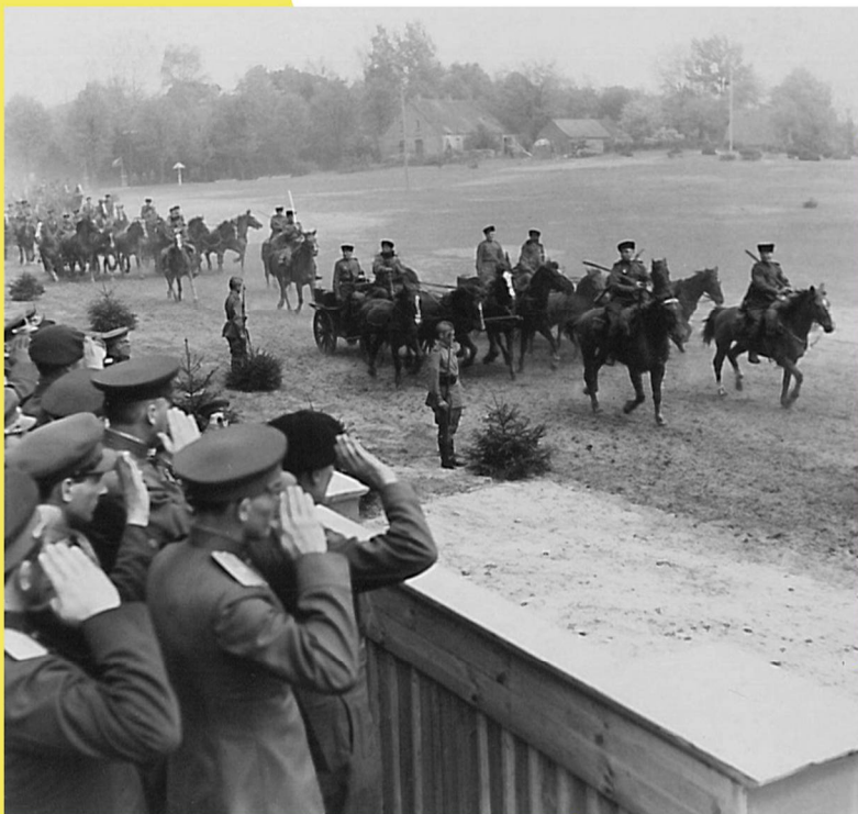
ФЕЛЬДМАРШАЛ Б. МОНТГОМЕРИ ПРИНИМАЕТ ПАРАД ПОЧЕТНОГО КАРАУЛА ВО ВРЕМЯ ВИЗИТА В ШТАБ МАРШАЛА К.К.РОКОССОВСКОГО. 10 МАЯ 1945 Г.