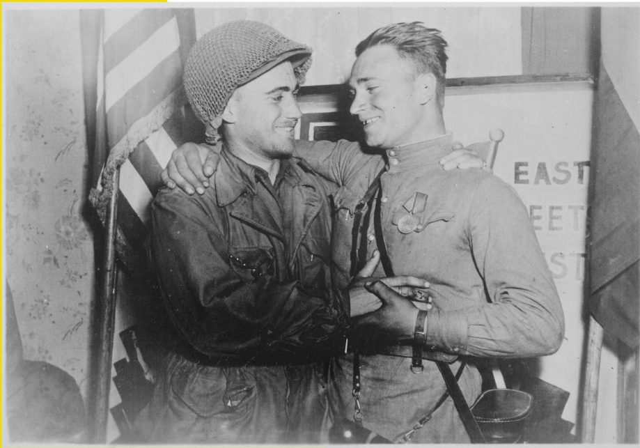
ЛЕЙТЕНАНТ АРМИИ США ВИЛЬЯМ РОБЕРТСОН И ЛЕЙТЕНАНТ СОВЕТСКОЙ АРМИИ АЛЕКСАНДР СИЛЬВАШКО. ТОРГАУ, 25 АПРЕЛЯ 1945 Г.