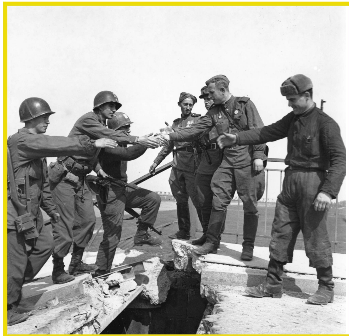
РУКОПОЖАТИЯ СОВЕТСКИХ СОЛДАТ ИЗ 58-Й ГВАРДЕЙСКОЙ СТРЕЛКОВОЙ ДИВИЗИИ И АМЕРИКАНСКИХ СОЛДАТ ИЗ 69-Й ПЕХОТНОЙ ДИВИЗИИ. 25 АПРЕЛЯ 1945 Г.