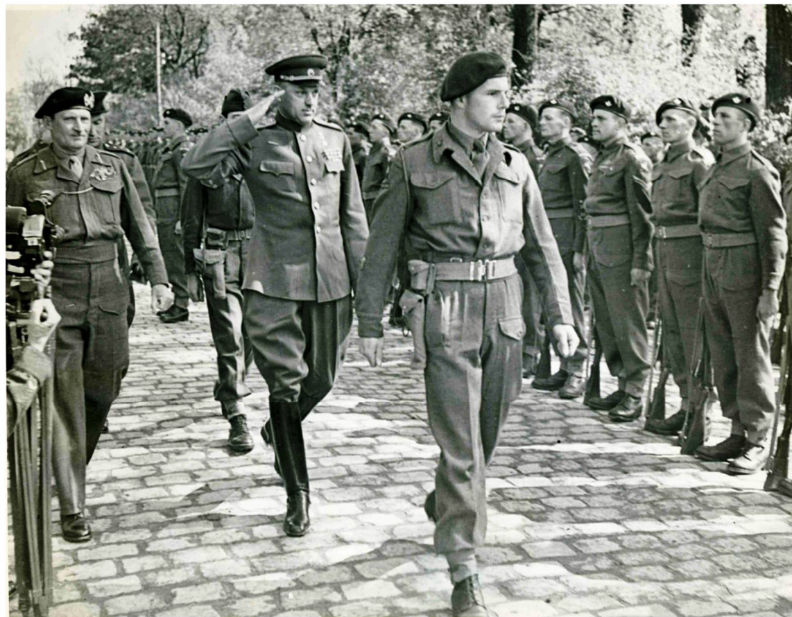
МАРШАЛ К.К. РОКОССОВСКИЙ И ФЕЛЬДМАРШАЛ Б. МОНТГОМЕРИ ПРОХОДЯТ ВДОЛЬ СТРОЯ ПОЧЁТНОГО КАРАУЛА СОЛДАТ 6-Й ВОЗДУШНО-ДЕСАНТНОЙ ДИВИЗИИ КОРОЛЕВСКИХ ВВС. ВИСМАР, 7 МАЯ 1945 Г.