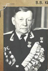
КИРИЛКОВ В. В. 1963 Г.

ПОСЛЕ ОКОНЧАНИЯ ВОЙНЫ ЛЕЙТЕНАНТ В. В. КИРИЛКОВ ПРОДОЛЖАЛ СОВЕРШЕНСТВОВАТЬ ЛЕТНОЕ МАСТЕРСТВО. НАГРАДЫ: ЗОЛОТАЯ ЗВЕЗДА ГЕРОЯ СОВЕТСКОГО СОЮЗА, ДВА ОРДЕНА ЛЕНИНА, ПЯТЬ ОРДЕНОВ БОЕВОГО КРАСНОГО ЗНАМЕНИ, ОРДЕНА АЛЕКСАНДРА НЕВСКОГО, ОТЕЧЕСТВЕННОЙ ВОЙНЫ I СТЕПЕНИ, КРАСНОЙ ЗВЕЗДЫ, ЮГОСЛАВСКИЙ ОРДЕН «ПАРТИЗАНСКАЯ СЛАВА» I СТЕПЕНИ И 14 МЕДАЛЕЙ. УМЕР ПОДЛОЖКОВНИК В. В. КИРИЛКОВ 27 СЕНТЯБРЯ 1988 Г.