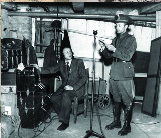
Диктор Зденек Манчал призывает пражан сражаться. 5 мая 1945 г.