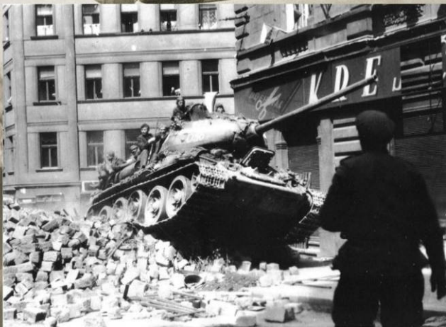
Советский танк с бойцами на борту преодолевает завалы на улице Праги. 9 мая 1945 г.