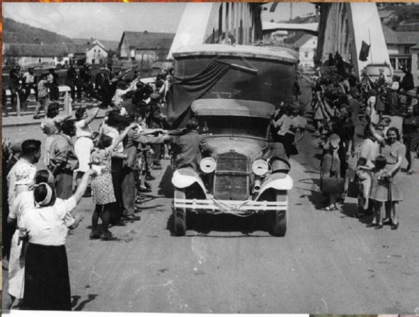
Жители Чехии приветствуют части Красной Армии. Май 1945 г.