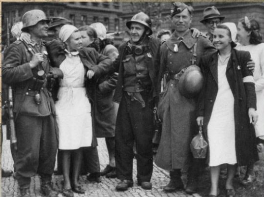
Солдаты 600-й пехотной дивизии вермахта (1-й пехотной дивизии РОА) с участниками Пражского восстания. 6 мая 1945 г.