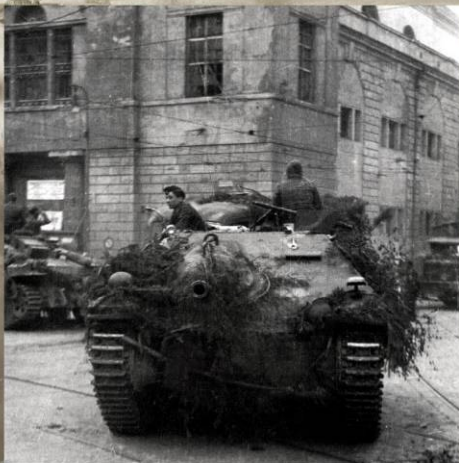
Немецкий истребитель танков «Хетцер» в Праге. 5-8 мая 1945 г.