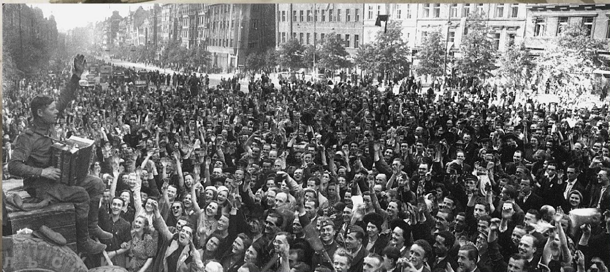
Советский солдат играет на гармонике для жителей Праги. 9 мая 1945 г.