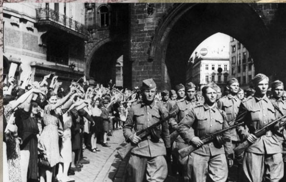
Горожане встречают бойцов 1-го Чехословацкого армейского корпуса, проходящих через Пороховую башню. Май 1945 г.