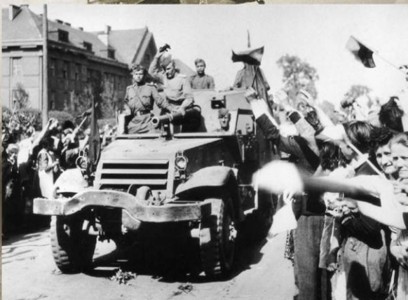
Советская САУ СУ-57 из состава 70-й гвардейской самоходно-артиллерийской бригады на улице Праги. 9 мая 1945 г.