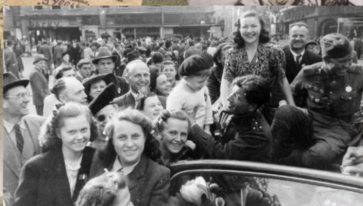
Жители освобожденной Праги и советские солдаты. 9 мая 1945 г.