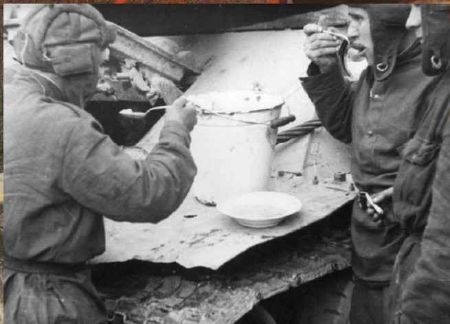
Танкисты обедают во время марша на дорогах Чехословакии. Май 1945 г.