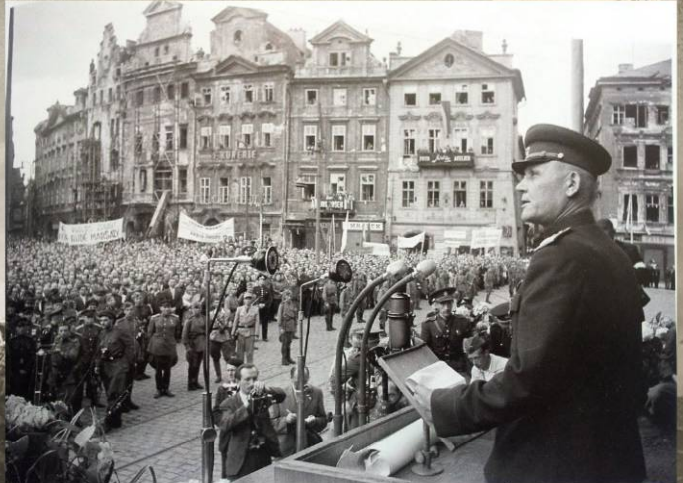
Маршал И.С. Конев на Староместской площади выступает на митинге перед жителями Праги. 11 мая 1945 г.