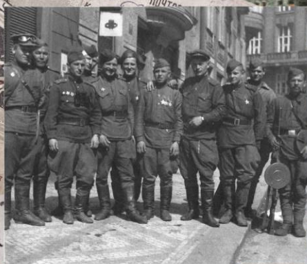
Красноармейцы на улице Праги. 9 мая 1945 г.