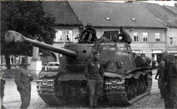
Советская САУ ИСУ-122с на одной из улиц города Собеслав в Чехословакии. Май 1945 г.