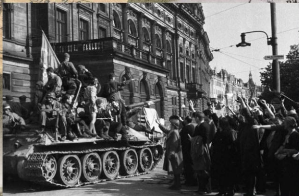
Жители Праги приветствуют советских солдат и повстанцев, едущих на танке Т-34-85, 9 мая 1945 г.