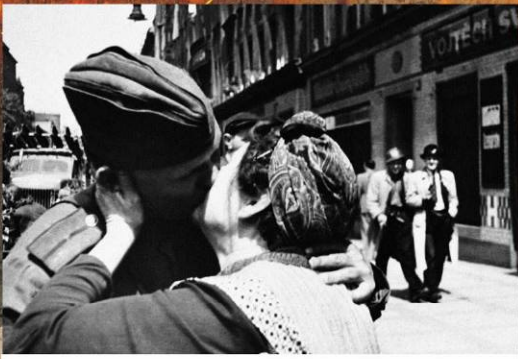
Чешская женщина целует советского офицера на улице Праги. 9 мая 1945 г.