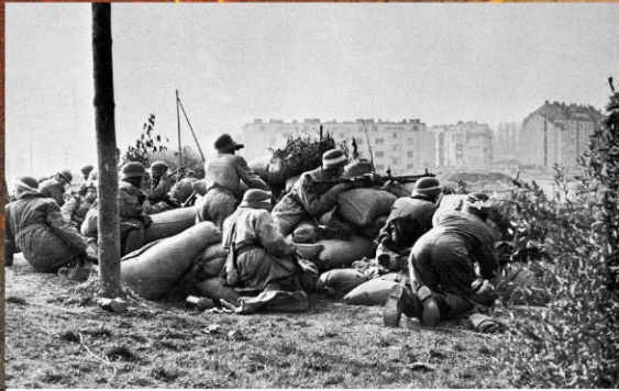
Пражские повстанцы на позиции во время Пражского восстания. 5-8 мая 1945 г.