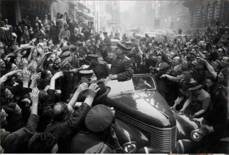
Командующий 1-м Украинским фронтом маршал Советского Союза И.С. Конев в освобожденной Праге. 11 мая 1945 г.