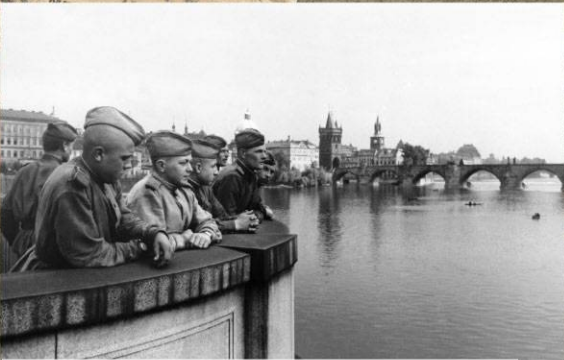
Красноармейцы на мосту через Влтаву в освобожденной Праге. Май 1945 г.

Смерть немецким ВОЙНСКОЕ Кодл 2. Ж Собнае ул. Ша