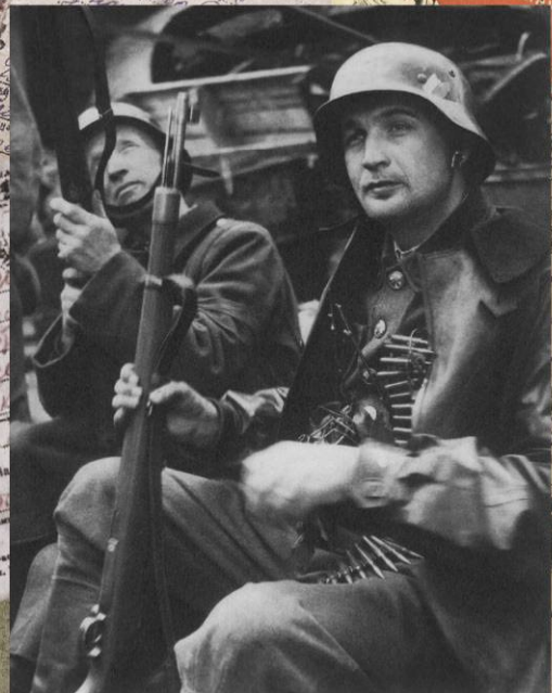
Пражские повстанцы в немецком обмундировании и с немецким оружием на одной из уличных баррикад. 5-8 мая 1945 г.