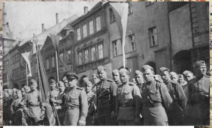
Построение бойцов 174-го отдельного истребительного противотанкового артиллерийского дивизиона им. Комсомола Удмуртии в городе Хомутово. Май 1945 г.