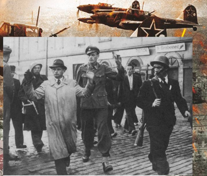
Вооруженные пражские рабочие ведут по улице пленных сотрудника гестапо и гауптшарфюрера СС. 5 мая 1945 г.