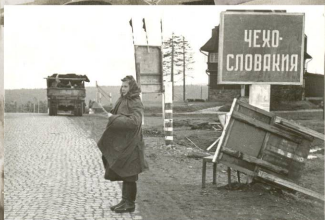
На границе Чехословакии. Май 1945 г.