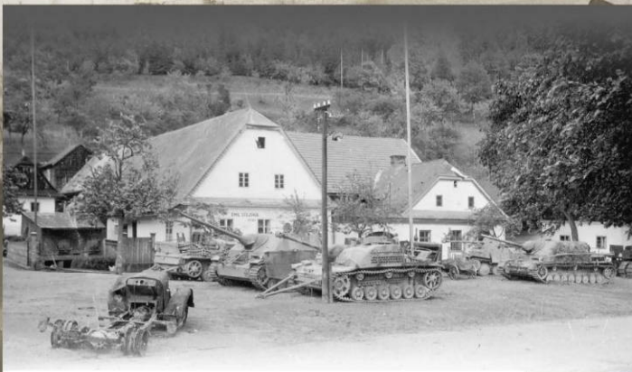
Немецкая бронетехника, брошенная в полосе наступления 4-го Украинского фронта в Чехословакии. Май 1945 г.