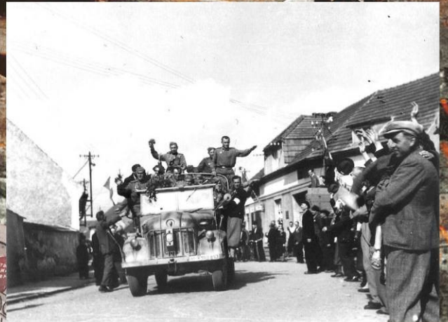
Жители освобожденного чешского города Веселы-над-Лужницами приветствуют советских солдат 2-го Украинского фронта. Май 1945 г.