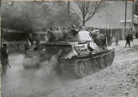
Пражские повстанцы на танке Т-34 из состава 600-й пехотной дивизии вермахта (1-я пехотная дивизия РОА). 6 мая 1945 г.