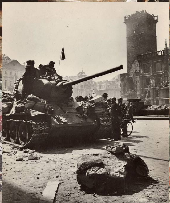
Танк 29-й гвардейской мотострелковой бригады 10-го УДТК на Староместской лошади Праги. 9 мая 1945 г.