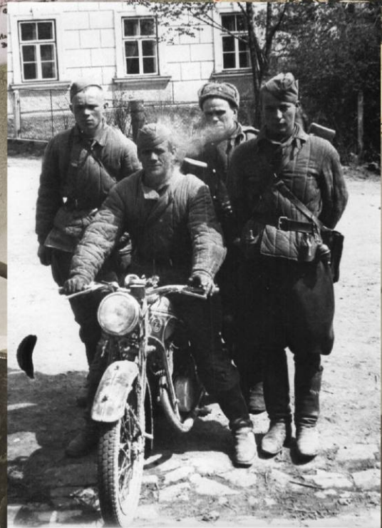
Солдаты 4-го Украинского фронта в освобожденном чешском городке Цотките. Май 1945 г.