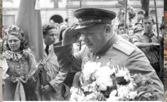
Командующий 4-м Украинским фронтом генерал армии А.И. Еременко в освобожденном чешском городе Оломоуц. 7 мая 1945 г.