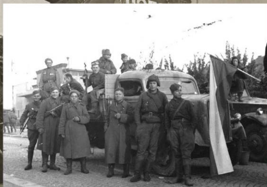
Советские солдаты у трофейного грузовика на дороге в Чехословакии. Май 1945 г.