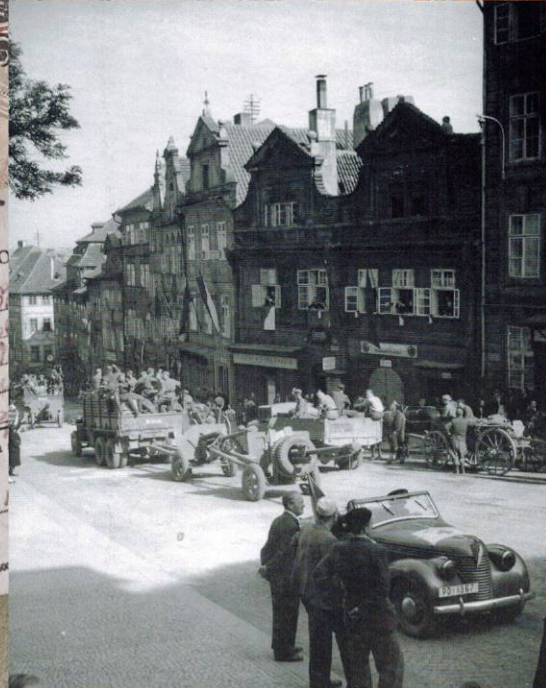
Колонна советской артиллерийской части на улице Nerudova в Праге. Май 1945 г.