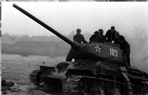
Танкисты 1-го Украинского фронта форсируют реку в Чехословакии. Май 1945 г.