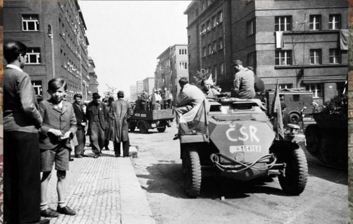
Пражские повстанцы на трофейном немецком бронетранспортере Sd.Kfz. 250 в районе Пращка. 5-8 мая 1945 г.