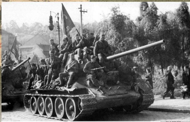
Танки 55-й гвардейской танковой бригады 3-й гвардейской танковой армии въезжают в Прагу. 9 мая 1945 г.