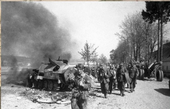
Колонна пленных немецких солдат. Чехословакия, май 1945 г.