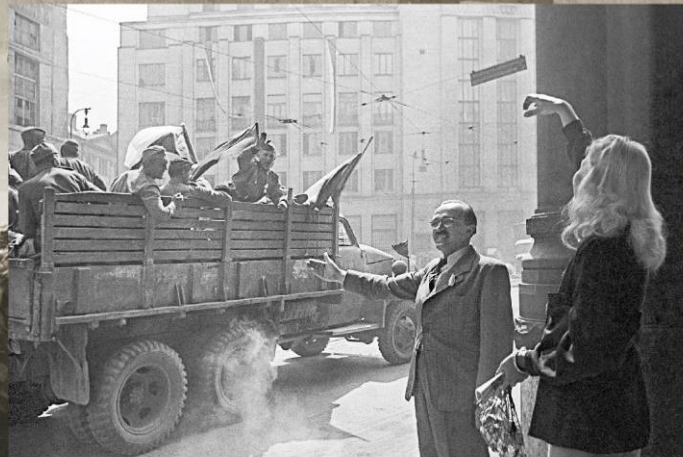
Пражане приветствуют советских бойцов. 9 мая 1945 г.