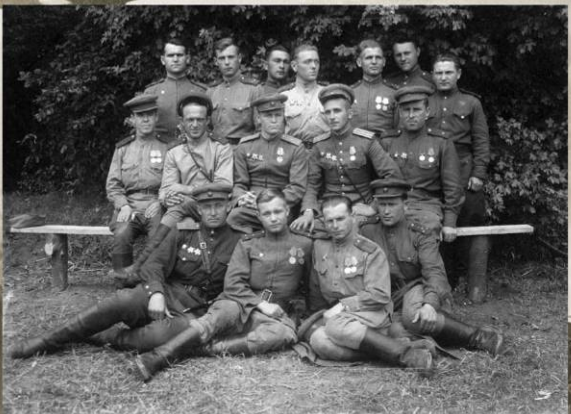
Группа офицеров 121-го стрелкового полка 9-й пластунской стрелковой дивизии. Чехословакия, май 1945 г.