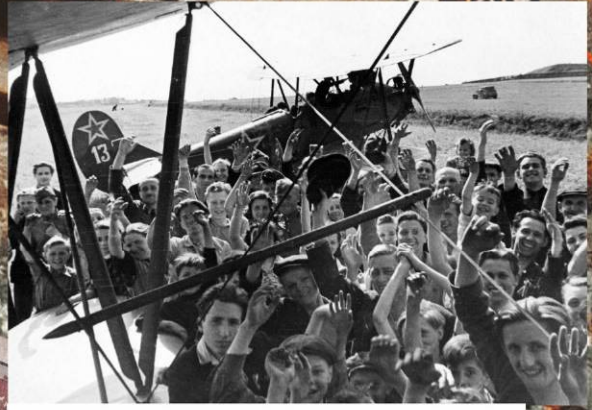
Жители Праги встречают советские самолёты У-2 на одном из городских стадионов. 9 мая 1945 г.