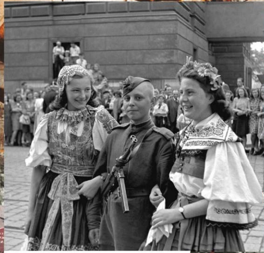
Красноармеец с пражскими девушками. 9 мая 1945 г.