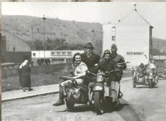
Мотоциклисты-разведчики 7-го отдельного гвардейского мотоциклетного батальона на улицах Праги. 9 мая 1945 г.