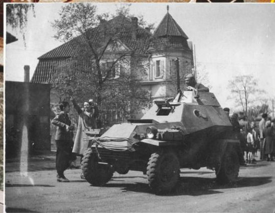
Советский броневладелец БА-64 в Чехословакии. Май 1945 г.