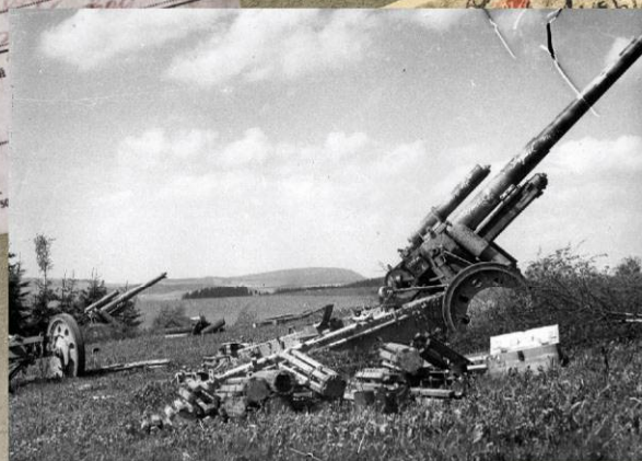
Брошенные немецкие 150-мм тяжелые полевые гаубицы sFH18. Чехословакия, май 1945 г.