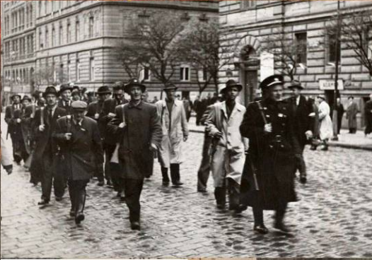
Пражские повстанцы. 5 мая 1945 г.