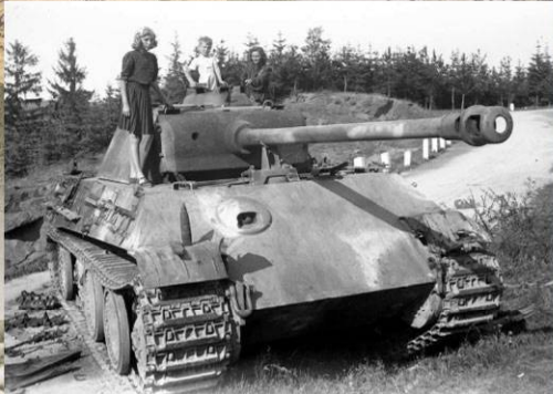
Дети позируют на немецком танке Pz. Krfw. V Ausf. G, брошенном вблизи города Чимерж, в полосе наступления 2-го Украинского фронта. Май 1945 г.