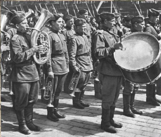
Советский военный оркестр на улице Праги. Май 1945 г.