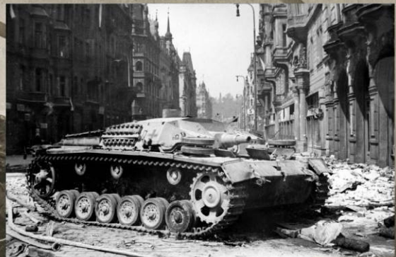
Немецкая САУ StuG III Ausf. B, подбитая в Праге. 9 мая 1945 г.