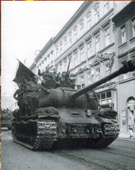
Танки ИС-2 на улице Праги. Май 1945 г.