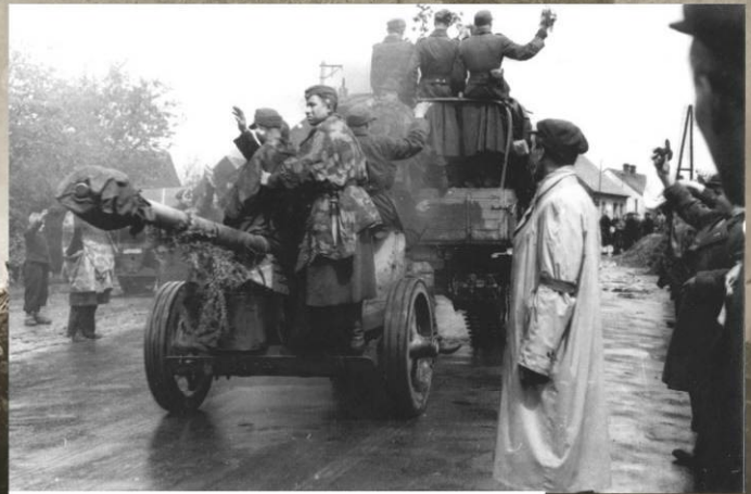
Жители пригорода Праги Горжелице приветствуют солдат 600-й пехотной дивизии вермахта (1-я пехотная дивизия РОА). 6 мая 1945 г.