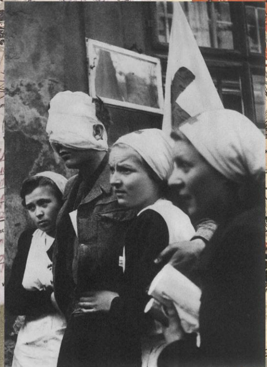
Медсестры ведут пражского повстанца, раненого в бою у ратуши на Староместской площади. 5-8 мая 1945 г.