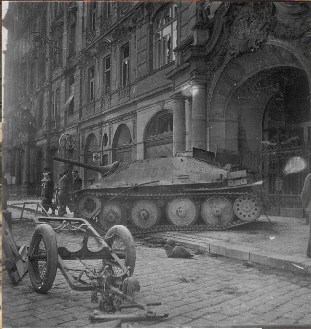
Немецкий истребитель танков Jagdpanzer 38(t) «Hetzer» подбитый во время боёв на улице Праги. 9 мая 1945 г.