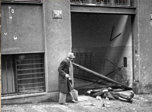
Пражский повстанец рядом с убитым товарищем во время боя за «Дом Радио» в первые часы Пражского восстания. 5 мая 1945 г.