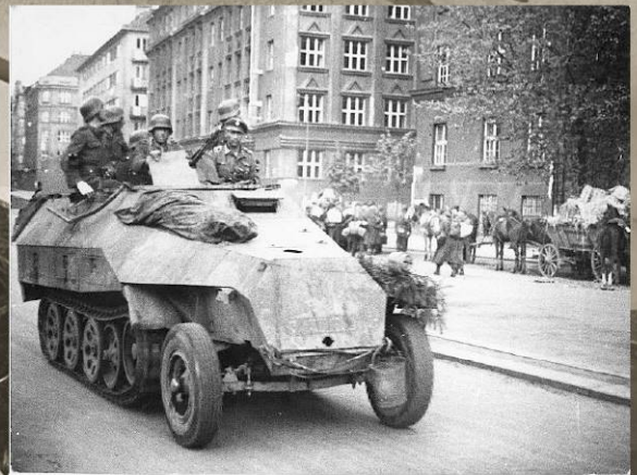
Немецкие солдаты на БТР Sd.Kfz. 251 в Праге. 5-8 мая 1945 г.