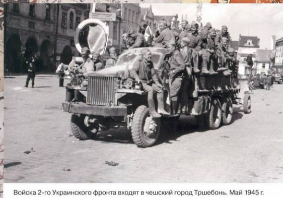
Войска 2-го Украинского фронта входят в чешский город Тршебонь. Май 1945 г.