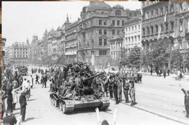
Советский танк Т-34-85 с пражскими повстанцами на броне едет по Вацлавской площади Праги. 9 мая 1945 г.