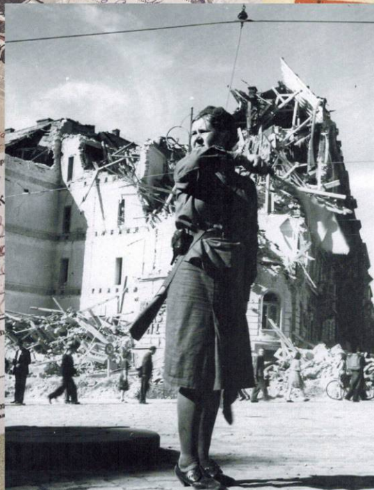
Регулировщица на Вацлавской площади Праги. Май 1945 г.