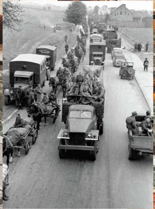
Советские войска на шоссе под Берлином. 20 апреля 1945 г.