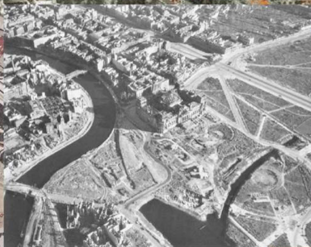
Вид с воздуха на район Королевской площади и здание Рейхстага. Май 1945 г.