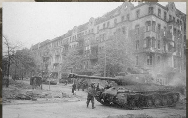
Советские тяжелые танки ИС-2 на Проскауэрштрассе в Берлине. Апрель 1945 г.