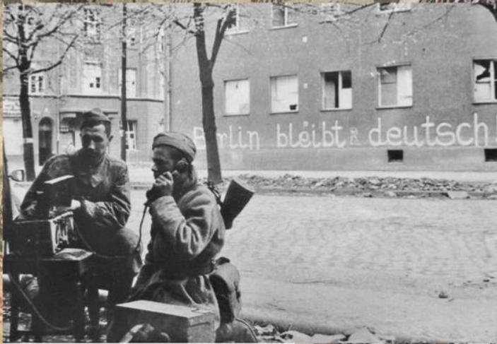
Связисты Красной Армии на улице Берлина. Апрель 1945 г.