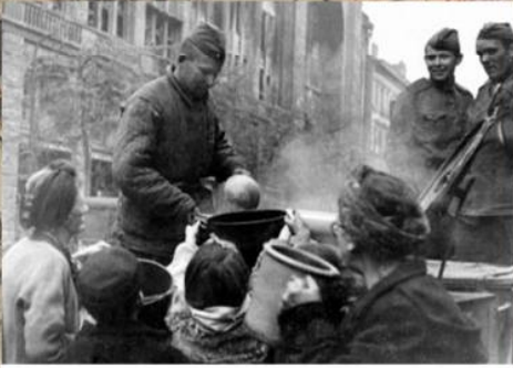
Повар Красной армии раздаёт пищу жителям Берлина. Апрель 1945 г.