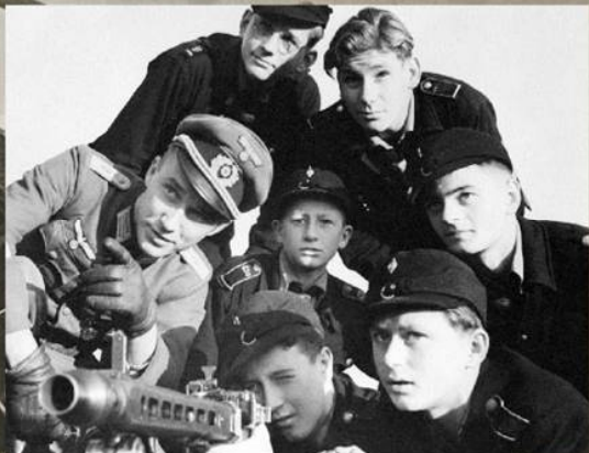
Немецкий офицер обучает подростков из гитлерюгенда навыкам стрельбы из пулемета MG-42. Апрель 1945 г.