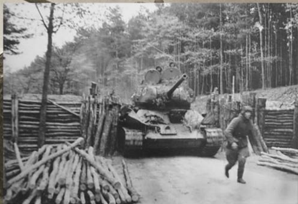
Танк Т-34-85 7-го гвардейского танкового корпуса проезжает мимо баррикады по дороге на Берлин. Апрель 1945 г.