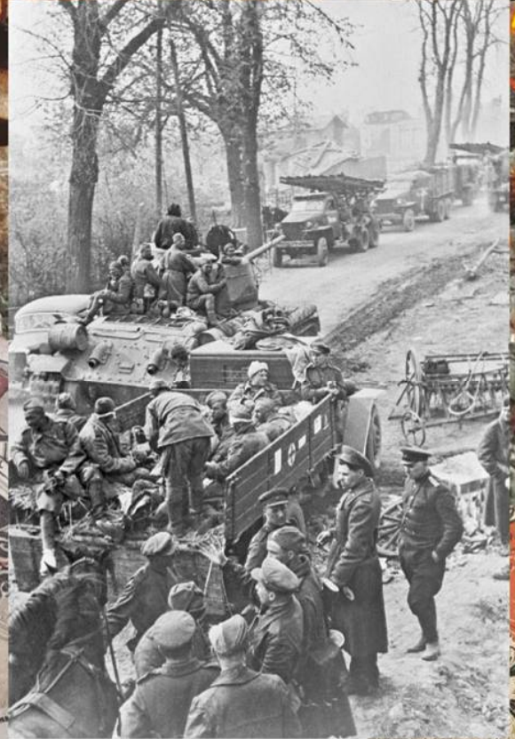
Погрузка раненых советских солдат на военный грузовик для эвакуации. Апрель 1945 г.