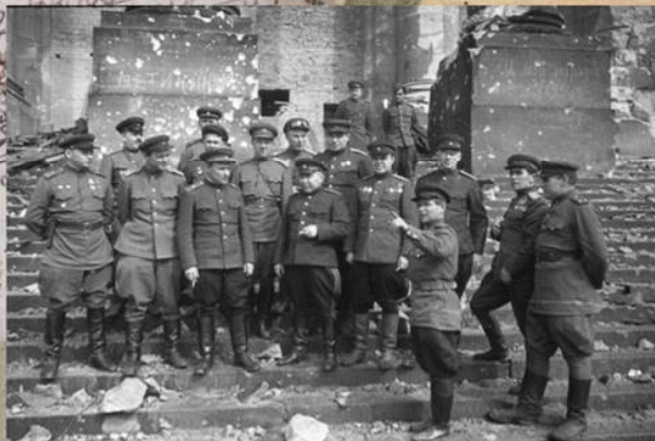
Командир 756-го полка полковник Ф.М. Зинченко докладывает командиру 3-й ударной армии генерал-полковнику В.И. Кузнецову (в центре) о ходе штурма Рейхстага. Берлин, 2 мая 1945 г.