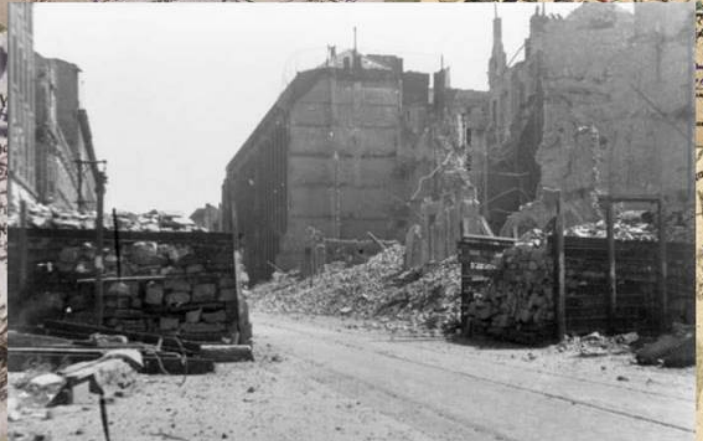
Остатки противотанковых заграждений в Берлине. Апрель 1945 г.