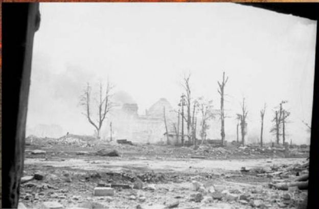
Вид на Рейхстаг из подвала здания МВД («Дома Гимmlера»). Май 1945 г.