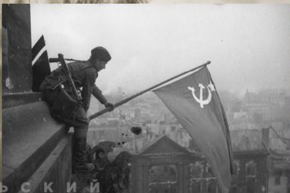
Сержант А.Л. Ковалев с красным знаменем на крыше рейхстага. Постановочная фотография Е.А.Халдея. 2 мая 1945 г.