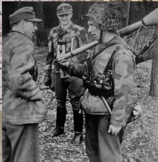
Немецкие офицеры, инспектирующие части на Одере, разговаривают с солдатом с гранатометом «Панцерфауст». Апрель 1945 г.