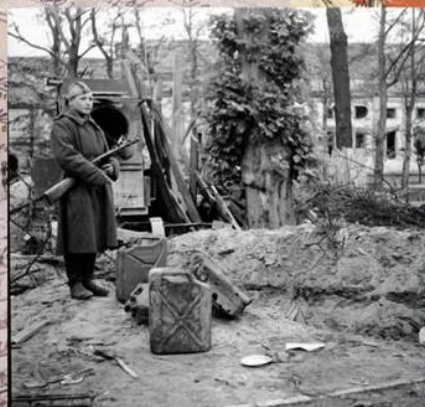
Советский солдат стоит у ямы в саду рейхсканцелярии, где было сожжено тело А. Гитлера после его самоубийства. Берлин, май 1945 г.