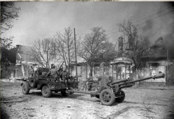
Артиллеристы 1-го Украинского фронта движутся на Берлин. Апрель 1945 г.