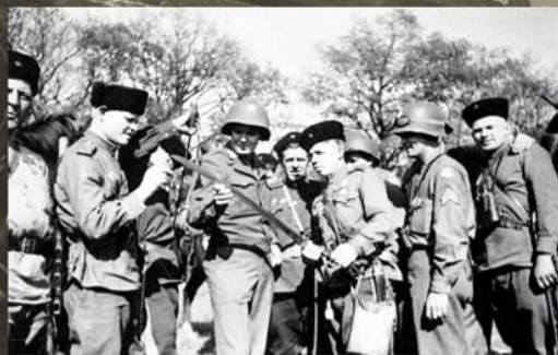
Кавалерист 3-го гвардейского кавалерийского корпуса демонстрирует свое оружие во время встречи с американскими солдатами, 4 мая 1945 г.