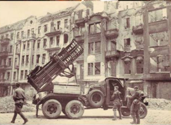
Реактивная артиллерийская установка БМ-31-12 на улице Берлина. Апрель 1945 г.