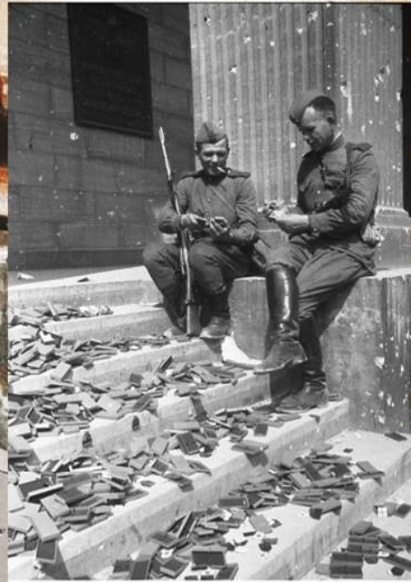
Советские солдаты, сидя на ступенях рейхсканцелярии, рассматривают немецкие награды. Берлин. 2 мая 1945 г.