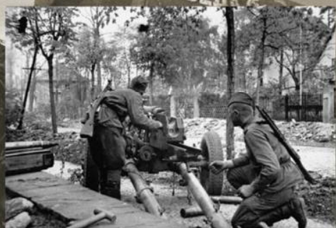
Советские артиллеристы ведут огонь из 76-мм дивизионного орудия ЗИС-3 в предместье Берлина. Апрель 1945 г.