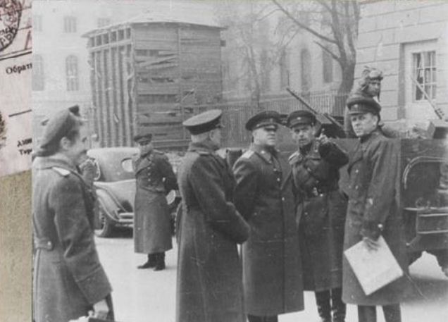
Командующий 1-м Белорусским фронтом Маршал Г.К. Жуков с группой офицеров в Берлине. 30 апреля 1945 г.