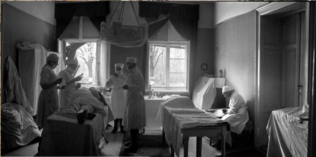
Операция в советском госпитале во время штурма Берлина. Апрель 1945 г.