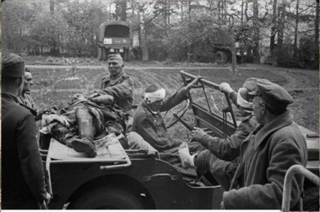
Раненые красноармейцы выгружаются из автомобиля «Виллис». Апрель 1945 г.