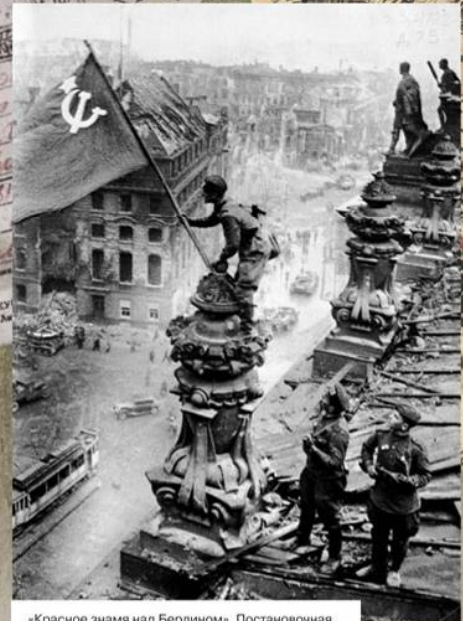
«Красное знамя над Берлином». Постановочная фотография Е.А. Халдея. 2 мая 1945 г.