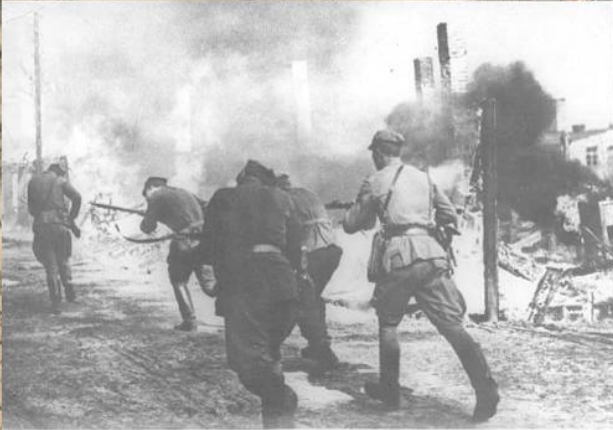
Солдаты Войска Польского во время уличных боев при штурме Берлина. Апрель 1945 г.