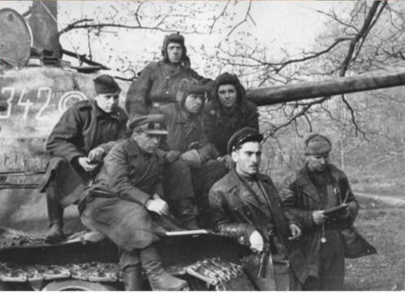
Бойцы и командиры 7-го гвардейского танкового корпуса у танка Т-34-85. Апрель 1945 г.