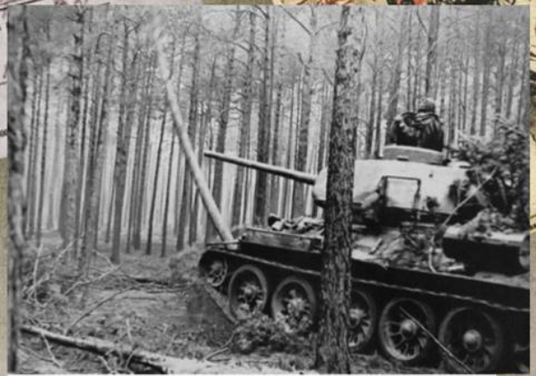
Советский танк Т-34-85 в сосновом лесу на подступах к Берлину. Апрель 1945 г.