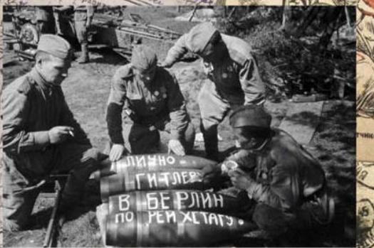
Советские артиллеристы пишут на 203-мм снарядах. Апрель 1945 г.