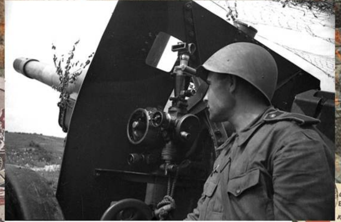
Советский артиллерист около своего орудия в районе Зееловских высот. Апрель 1945 г.