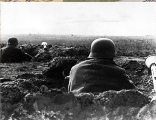
Немецкие солдаты на оборонительных позициях в районе Зееловских высот. Апрель 1945 г.