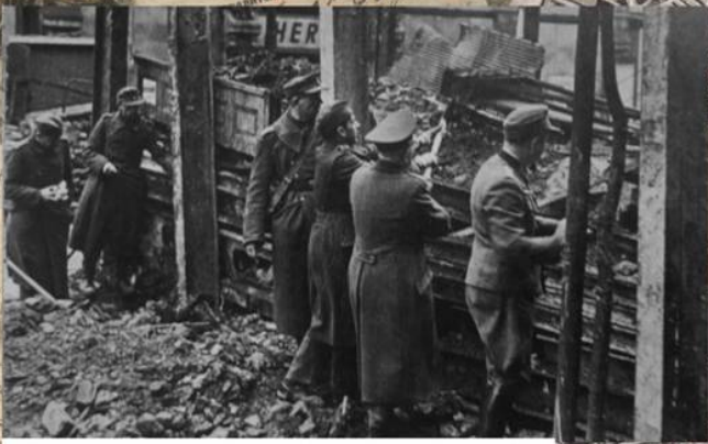
Немецкие солдаты возводят баррикады на улице Берлина. Апрель 1945 г.