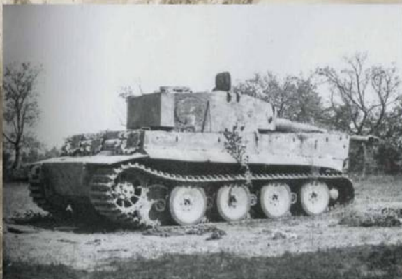
Брошенный немецкий танк Т-VI «Тигр» в районе Лихтерфельде. Берлин, апрель 1945 г.