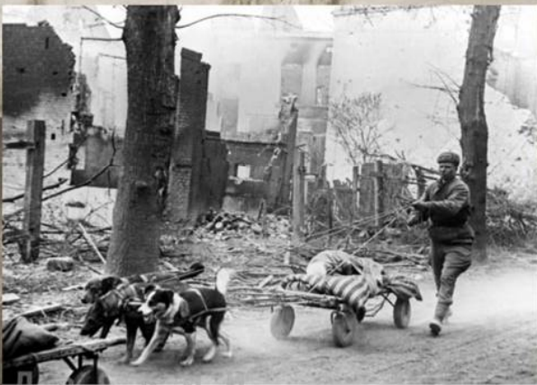
Советский санитар вывозит раненого бойца в тыл на тележке, запряженной собаками. Район Зеелевских высот. Апрель 1945 г.