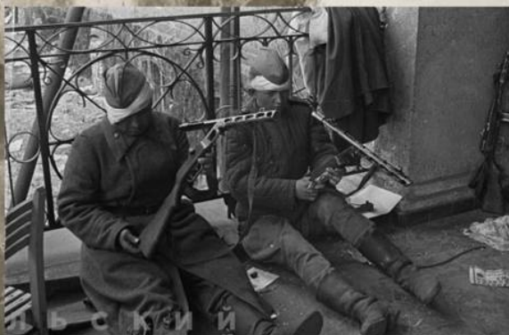
Раненые красноармейцы чистят свои ППШ после окончания боев за Берлин. Май 1945 г.