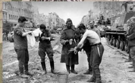
Советские танкисты моются после окончания боев на одной из улиц Берлина. Май 1945 г.