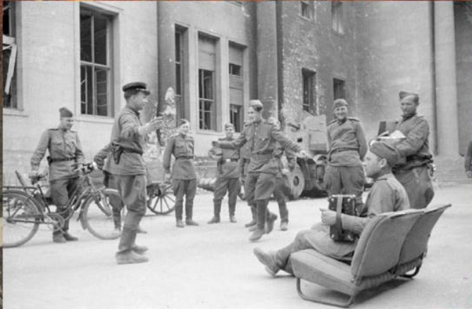
Бойцы РККА празднуют победу в «Почетном дворе» рейхсканцелярии в Берлине. Май 1945 г.