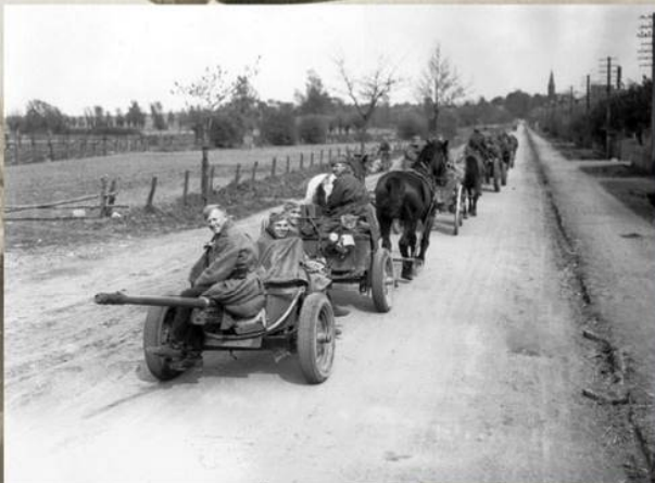
Артиллеристы на подступах к Берлину. Апрель 1945 г.