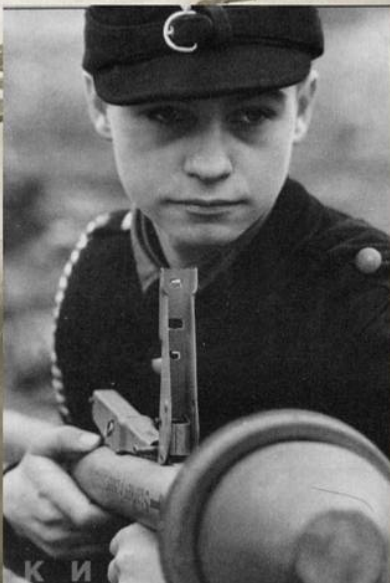
Мальчик из гитлерюгенда, вооруженный гранатометом «панцерфауст». Апрель 1945 г.