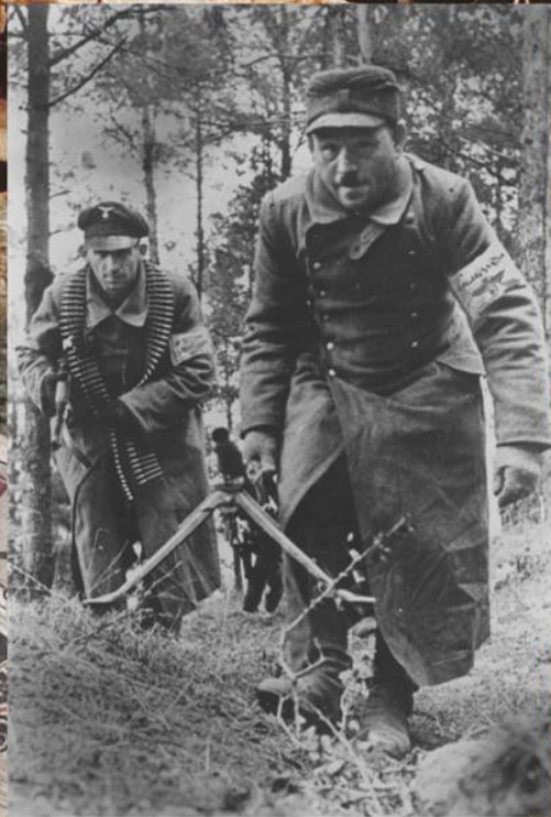
Ополченцы фольксштурма идут на позицию на Одере. Апрель 1945 г.