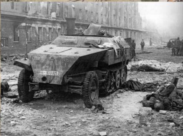
Подбитый бронетранспортер Sd.Kfz.250 из состава 11-й дивизии СС «Нордланд» на Фридрихштрассе в Берлине.