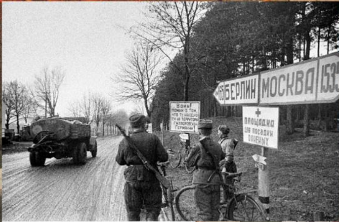
Красноармейцы у дорожного указателя. Апрель 1945 г.