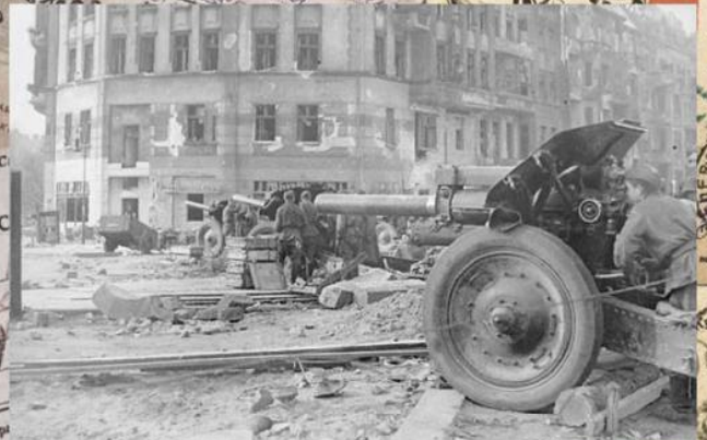
Батарея советских 122-мм гаубиц М-30, поставленных на прямую наводку, на улице Берлина. Апрель 1945 г.