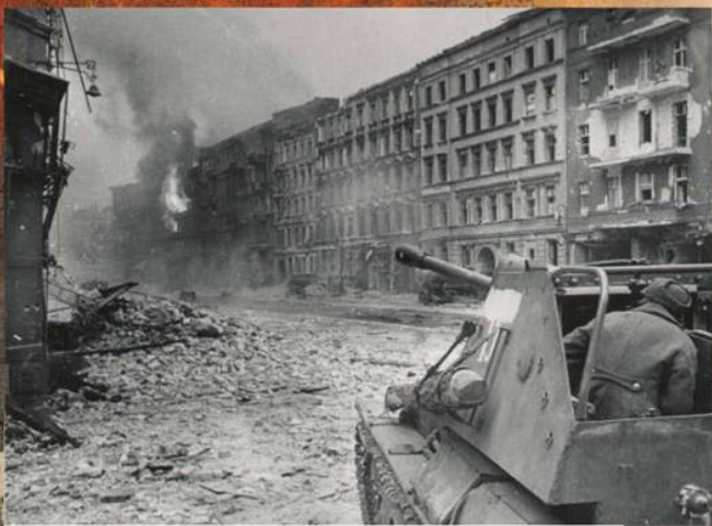
СУ-76 ведет огонь по вражеской позиции в ходе штурма Берлина. 30 апреля 1945 г.