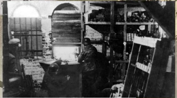
Немецкий пулемётный расчет на позиции. Берлин, апрель 1945 г.