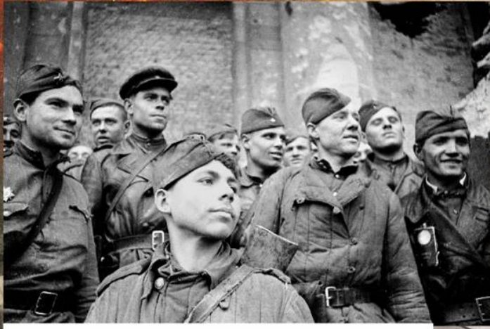
Взвод разведки 674-го стрелкового полка 150-й стрелковой Идрицкой дивизии. Май 1945 г.