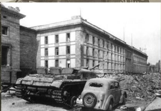
Здание новой рейхсканцелярии после боев. Берлин, 1945 г.