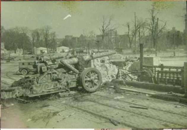
Баррикада на улице Берлина. Апрель 1945 г.