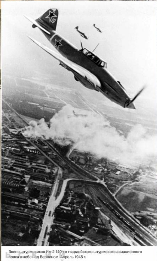
Звено штурмовиков Ил-2 140-го гвардейского штурмового авиационного полка в небе над Берлином. Апрель 1945 г.