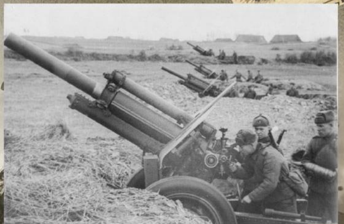
Батарея советских 122-мм гаубиц М-30 ведет огонь по немецким позициям. Апрель 1945 г.