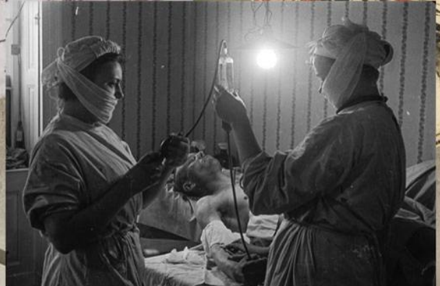
Медки делают переливание крови раненому советскому бойцу в Берлине. Апрель 1945 г.