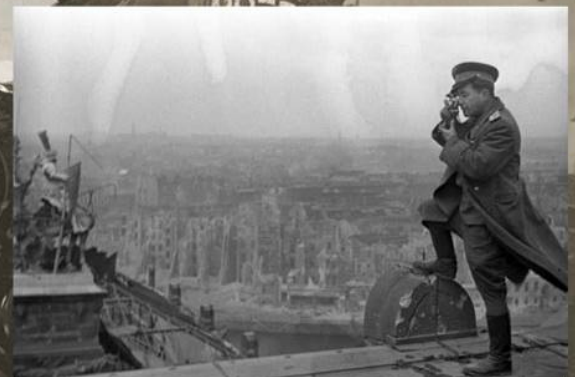
Фотограф Марк Реджин на крыше Рейхстага, напротив статуи императора Вильгельма на восточном фасаде. Берлин, 2 мая 1945 г.