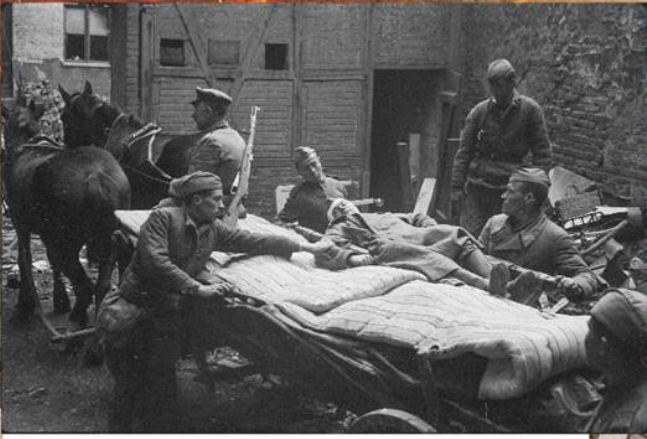
Советские санитары укладывают раненого красноармейца на конную повозку во дворе госпиталя в Берлине. Апрель 1945 г.