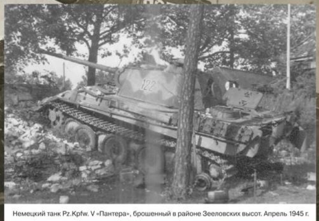
Немецкий танк Pz.Kpfw. V «Пантера», брошенный в районе Зееловских высот. Апрель 1945 г.