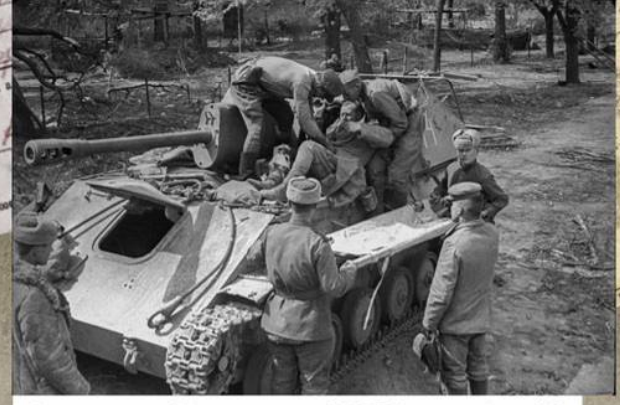
Раненого советского бойца переключают с САВ СУ-76М на носилки. Апрель 1945 г.