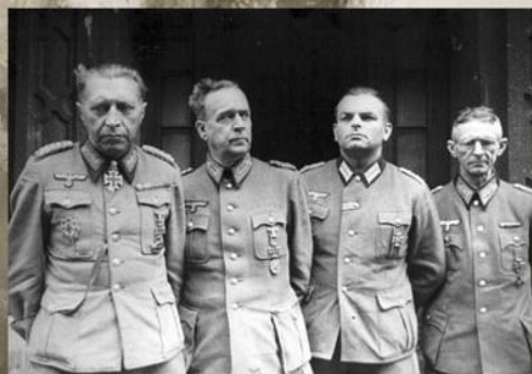
Сдавшийся в плен вместе с офицерами своего штаба последний комендант Берлина генерал Гельмут Вейдлинг (крайний слева), 2 мая 1945 г.