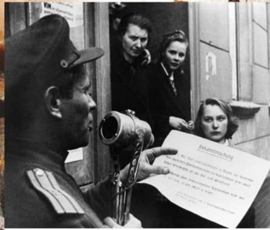
Советский офицер зачитывает населению текст о капитуляции немецкой армии в Берлине. 2 мая 1945 г.