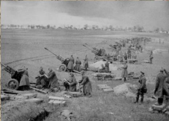
Расчеты советских 76-мм дивизионных пушек ЗИС-3 ведут артподготовку в районе Зееловских высот. 16 апреля 1945 г.