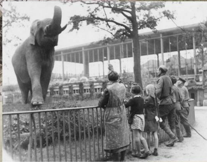
Солдаты Красной армии в Зоологическом саду Берлина. Май 1945 г.