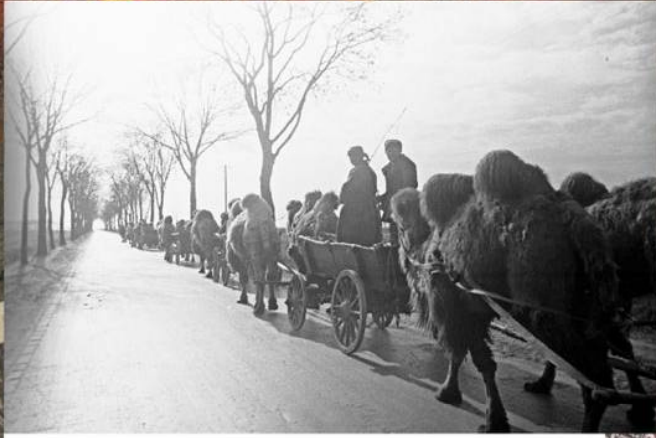
Верблюжий обоз одной из частей Красной армии на подступах к Берлину. Апрель 1945 г.