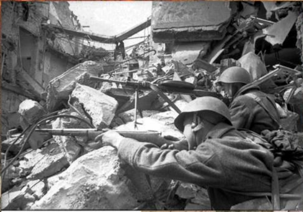
Уличный бой в Берлине. Апрель 1945 г.