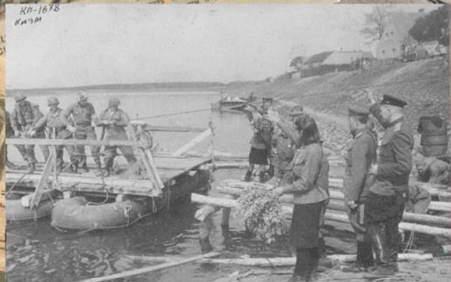
Встреча на Эльбе. Советские военнослужащие на берегу реки встречают прибывающих американцев, 29 апреля 1945 г.