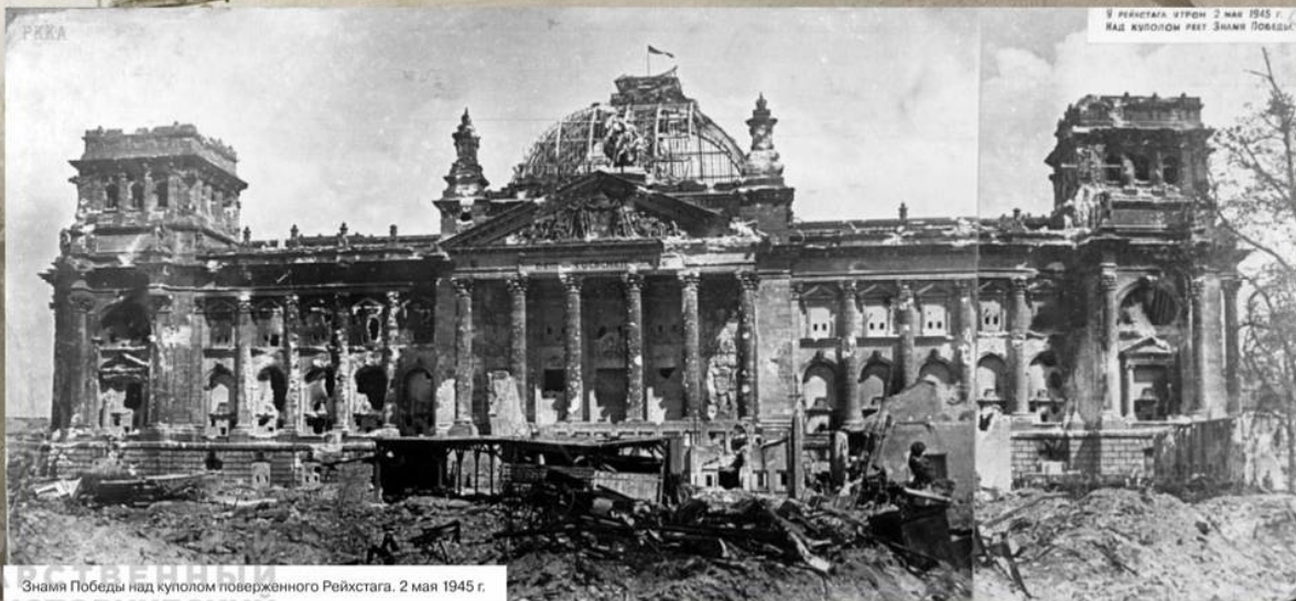
Знамя Победы над куполом поврежденного Рейхстага. 2 мая 1945 г.