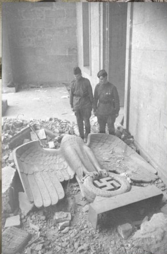
Имперский бронзовый орел, сбитый со своего места над входом в рейхсканцелярию. Берлин, май 1945 г.