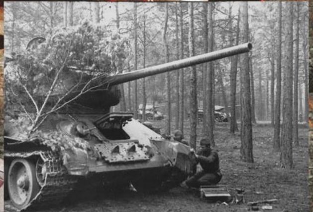
Ремонт танка Т-34-85 в лесном массиве на Берлинском направлении. Апрель 1945 г.