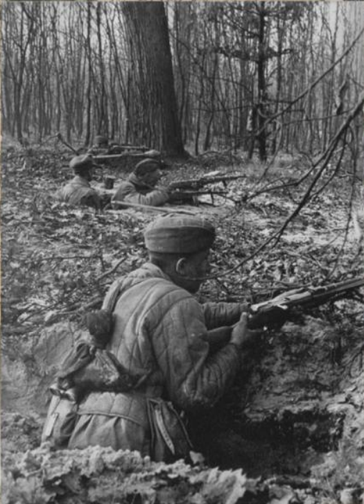
Советские бойцы в окопах на подступах к Берлину. Апрель 1945 г.