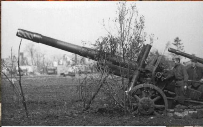
152-мм гаубицы МЛ-20 1-го Белорусского фронта на позиции. Апрель 1945 г.