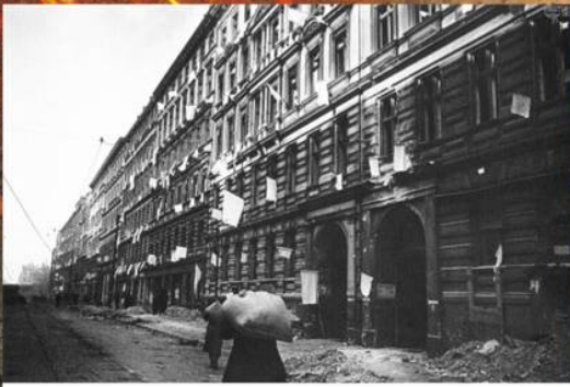
Белые флаги на берлинских домах после капитуляции. 2 мая 1945 г.