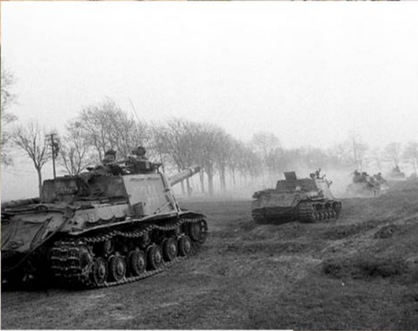
Колонна бронетанковой техники 1-го Украинского фронта на подступах к Берлину. Апрель 1945 г.