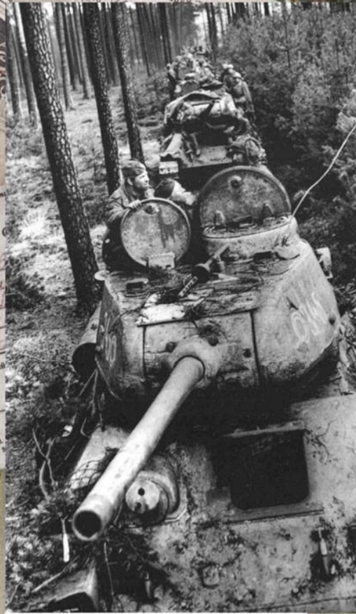
Колонна танков 3-й гвардейской танковой армии движется на Берлин. Апрель 1945 г.