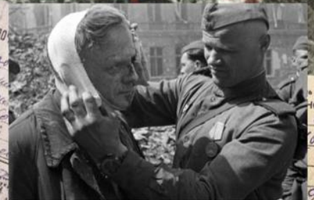
Советский солдат делает перевязку раненому берлинцу. Май 1945 г.