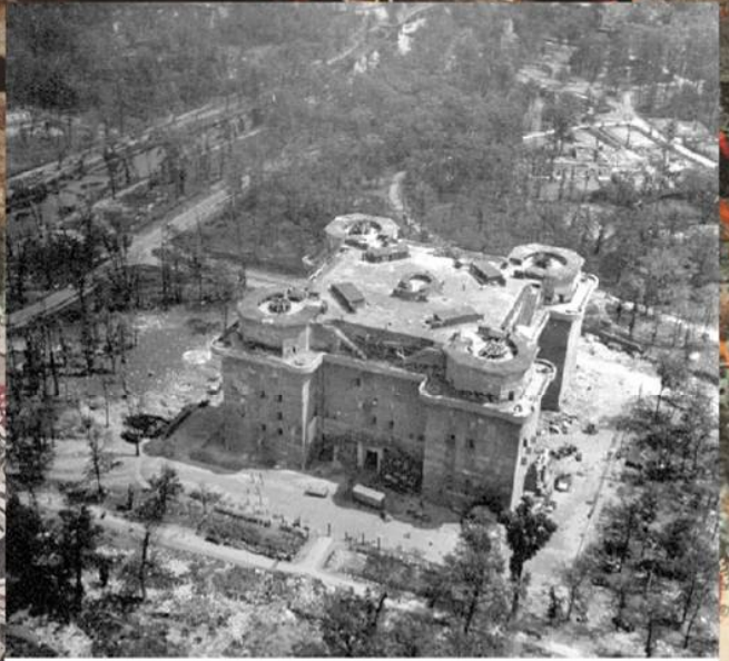
Зенитная башня Flakturm I в Берлинском зоопарке, командный пункт командующего обороной Берлина генерала Г. Вейдлинга. Апрель 1945 г.