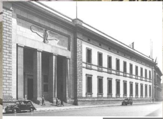
Здание новой рейхсканцелярии. Берлин, 1939 г.