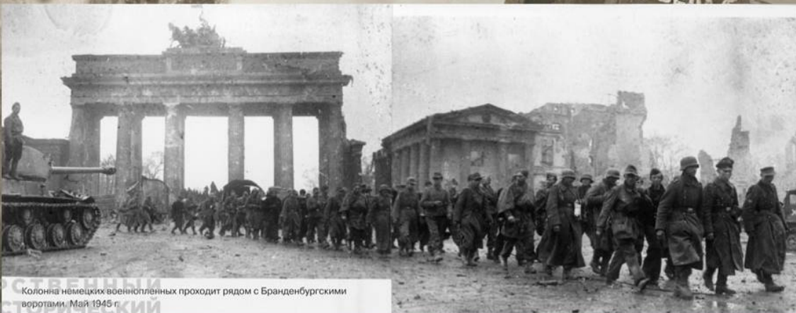
Колонна немецких военнопленных проходит рядом с Бранденбургскими воротами. Май 1945 г.