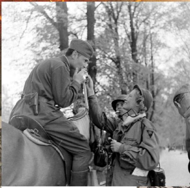
Встреча на Эльбе. Офицер 58-й гвардейской стрелковой дивизии с солдатами 69-й пехотной дивизии.