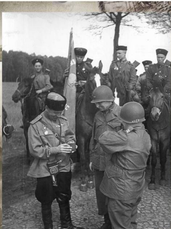
Кавалеристы 3-го гвардейского кавалерийского корпуса во время встречи с союзниками на Эльбе, 4 мая 1945 г.