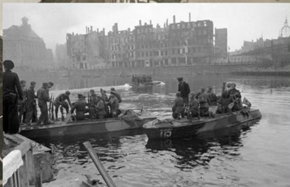
Полуглиссеры Днепровской военной флотилии переправляют войска через реку Шпрее в Берлине. 2 мая 1945 г.