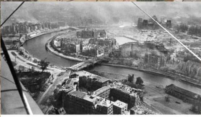
Вид на мост Мольтке, квартал правительственных зданий, в том числе посольство Швейцарии (справа), здание МВД (слева), котлован на Кёнигсплатц и Рейхстаг. Район боевых действий частей 79-го стрелкового полка 3-й ударной армии 1-го Белорусского фронта. Май 1945 г.