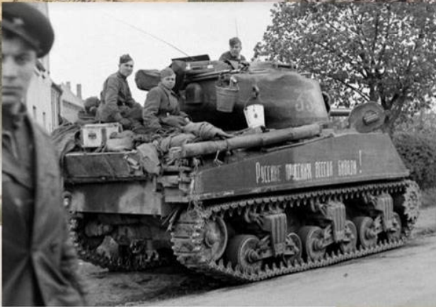
Танк М-4 «Шерман» 2-й гвардейской танковой армии. Апрель 1945 г.