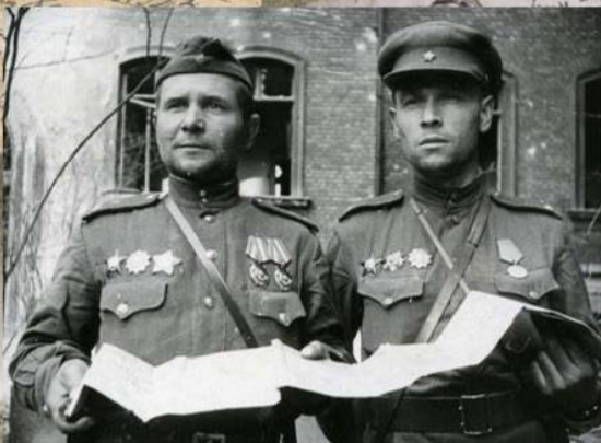
Командиры стрелковых полков 150-й стрелковой дивизии, бойцы которых первыми ворвались в Рейхстаг. Полковник Ф.М. Зинченко и подполковник А.Д. Плеходанов. Май 1945 г.