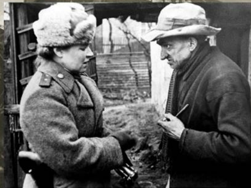
Советский военврач разговаривает с жителем Берлина. Май 1945 г.