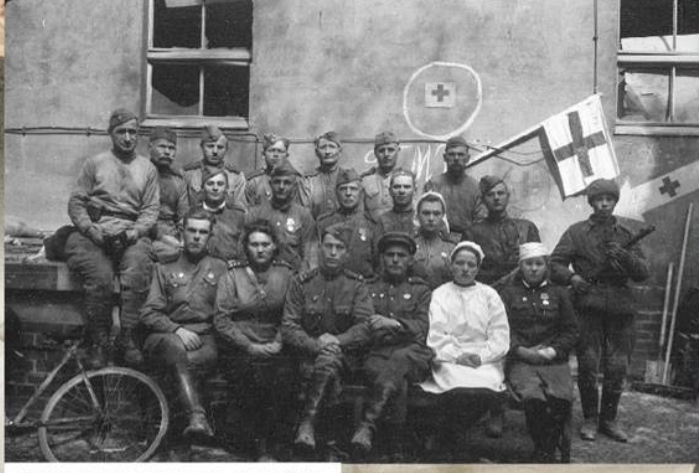
Персонал советского госпиталя. Апрель 1945 г.