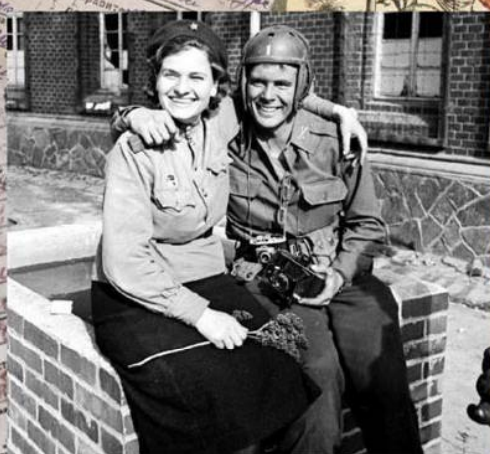
Встреча на Эльбе. Военный медик 58-й гвардейской стрелковой дивизии с солдатом 69-й пехотной дивизии.