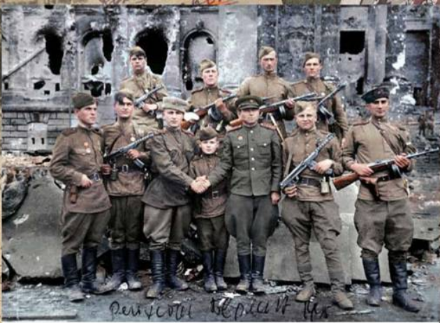
Разведчики 756-го стрелкового полка 150-й стрелковой Идрицкой дивизии возле Рейхстага. Берлин, 2 мая 1945 г.