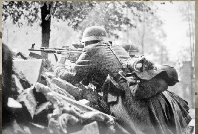
Немецкие солдаты на позиции на Колонненштрассе в Берлине. 28 апреля 1945 г.