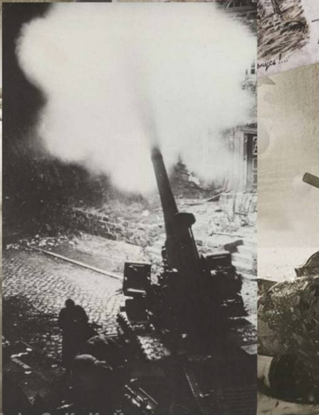
Советская 203-мм гаубица Б-4 ведёт огонь в ночном Берлине. Апрель 1945 г.