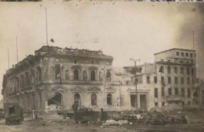
Красный флаг над рейхсканцелярией. Берлин, май 1945 г.