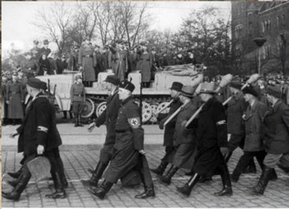
Парад частей фольксштурма в Берлине. Апрель 1945 г.