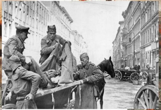
Советские санитары перекалывают с повозки на носилки раненого бойца. Медицинский пункт на Фридрихштрассе в Берлине. Апрель 1945 г.