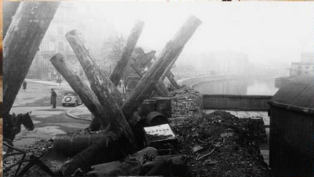
Вид на баррикады на мосту Мольтке. Апрель 1945 г.