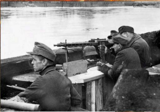
Немецкие пулеметчики на западном берегу Одера. Апрель 1945 г.