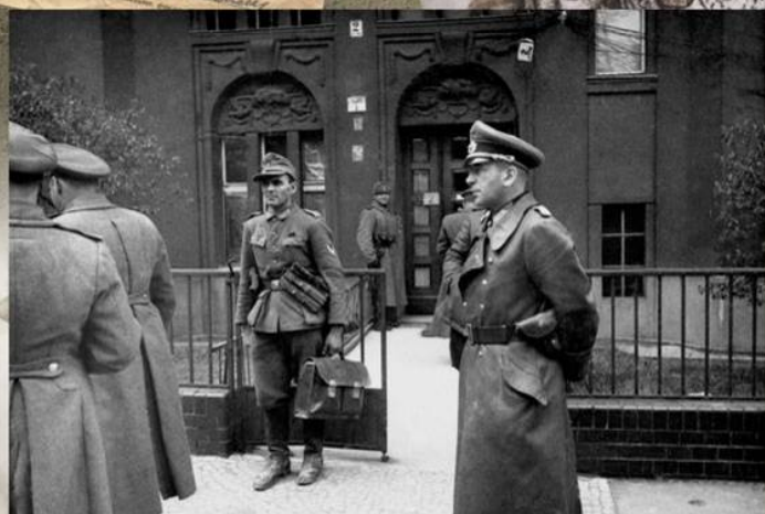
Начальник генерального штаба германских сухопутных войск генерал-лейтенант пехоты Г. Кребс у штаба генерал-полковника В.И. Чуйкова. Берлин, 1 мая 1945 г.