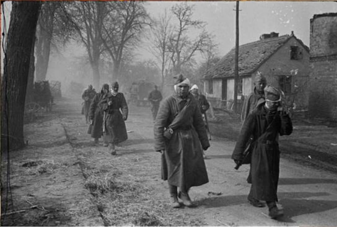
Раненые красноармейцы идут на пункт сбора в районе Зеелевских высот. Апрель 1945 г.