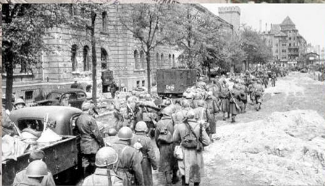
Колонна красноармейцев на Бель-Альянс-Штрассе в Берлине. Апрель 1945 г.