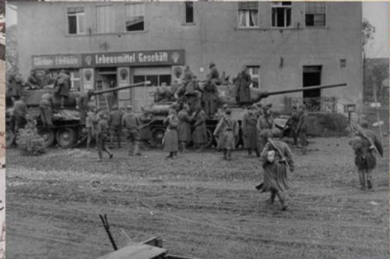
Солдаты и танки 2-й гвардейской танковой армии. Апрель 1945 г.