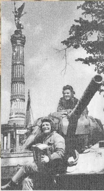
Советские танкисты позируют на фоне Колонны победы (Siegessäule) на площади Большая Звезда в Берлине. Май 1945 г.