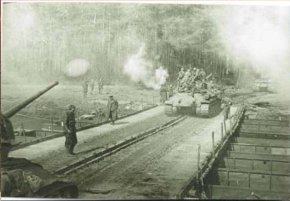
Танкисты 3-й гвардейской танковой армии 1-го Украинского фронта форсируют реку Нейсе. 16 апреля 1945 г.