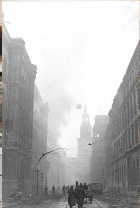
Советские солдаты идут по одной из улиц Берлина. Апрель 1945 г.