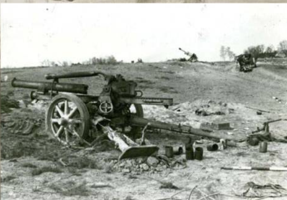
Разбитые немецкие орудия на Зееловских высотах. Апрель 1945 г.