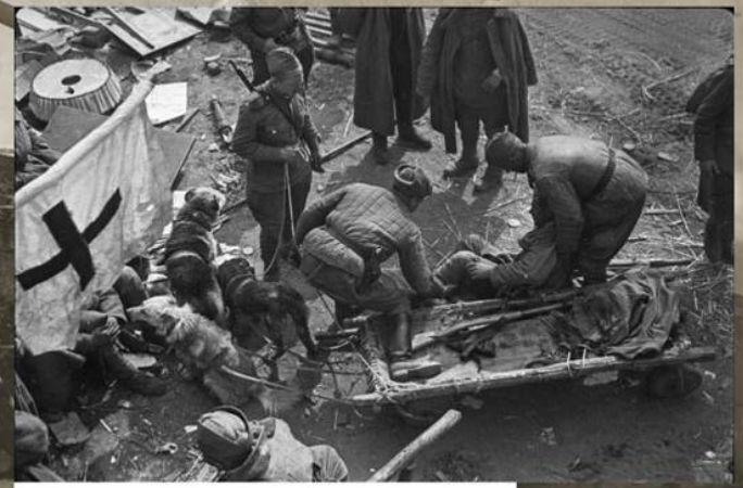
Доставка советских раненых в медсанбат на волокуше с собаками. Район Зеелевских высот. Апрель 1945 г.